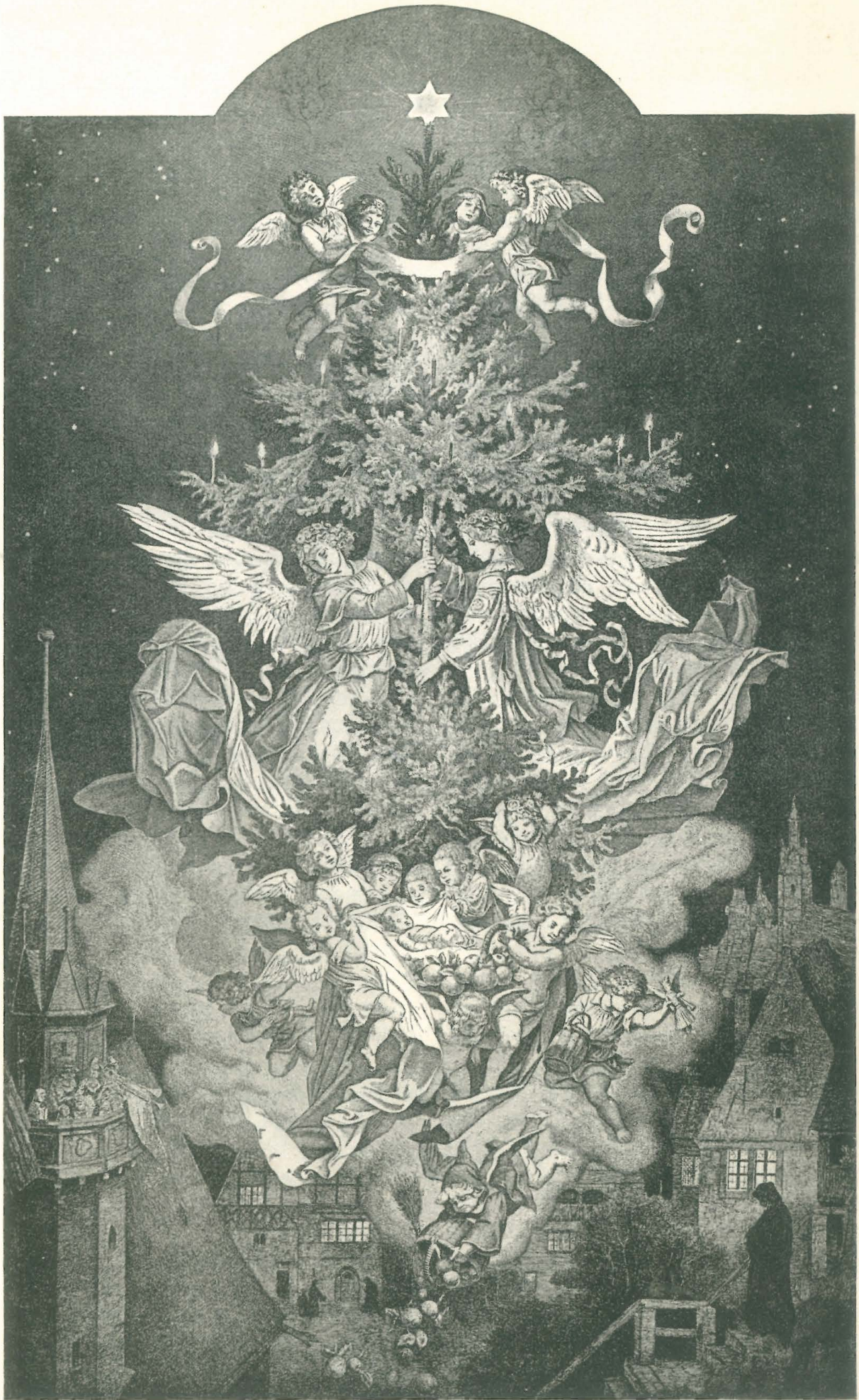
Der Weihnachtsbaum nach der Radierung von Ludwig Richter.