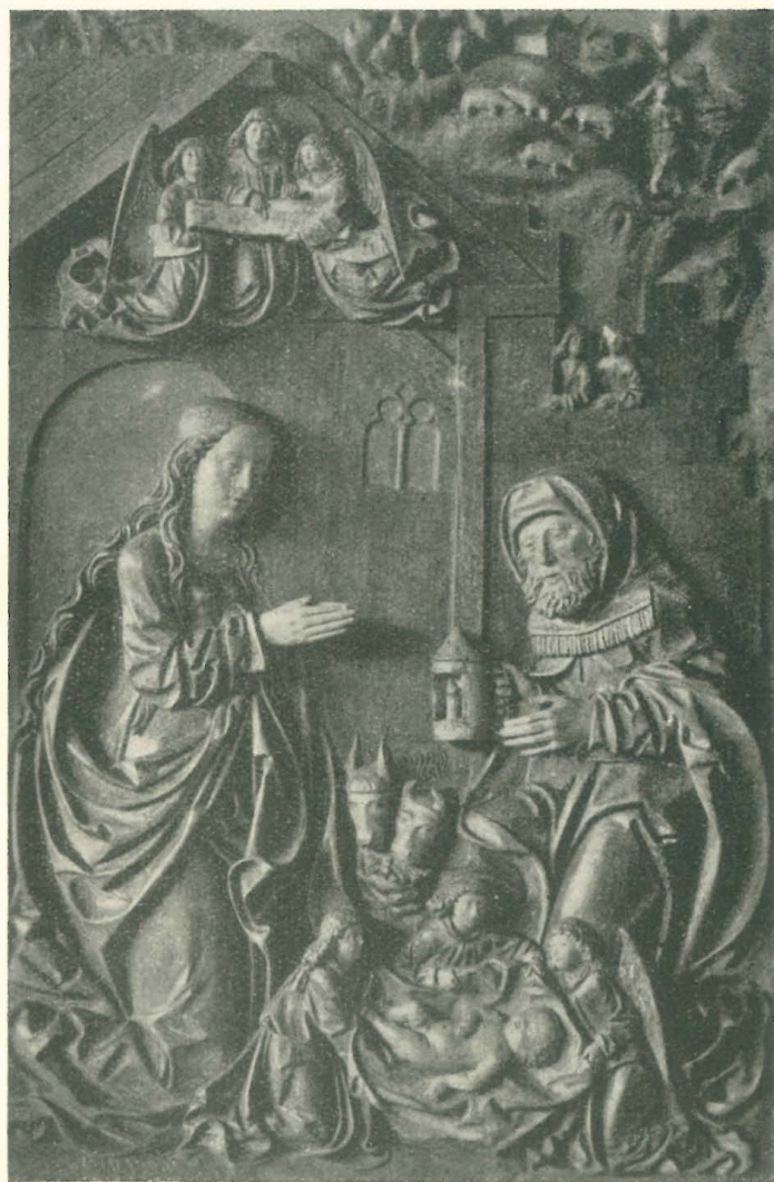
Die Geburt Christi (bemalte Holzplastik, 15. Jahrhundert) Das Original besitzen die Städtischen Kunstsammlungen Düsseldorf.

Es war Jan Wellems letztes Weihnachtsfest. Wenige Monate später schlossen sich seine Augen für immer. Er starb an einem Sommermorgen des Jahres 1716 auf dem Düsseldorfer Schloß, auf dem er vor 58 Jahren das Licht der Welt erblickt und in dem er sein arbeitsreiches Leben in einer fast vierzigjährigen Regierungszeit verbracht hat. „In Wahrheit der beste Fürst, der die Liebe und Verehrung Aller und ihre Tränen mit Recht verdiente und nun die größte Trauer hinterlassen hat.“ So heißt es in der Grabschrift auf seinem Sarkophag in der Hofkirche St. Andreas zu Düsseldorf.