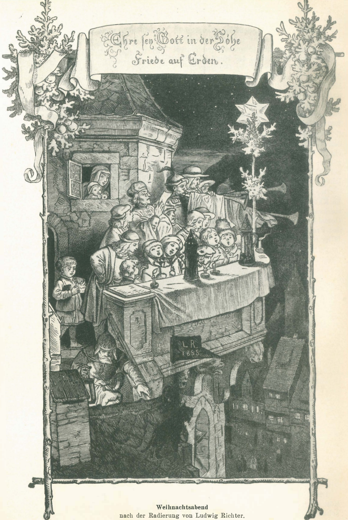
Weihnachtsabend nach der Radierung von Ludwig Richter.

Chre sey Gott in der Höhe Friede auf Erden.