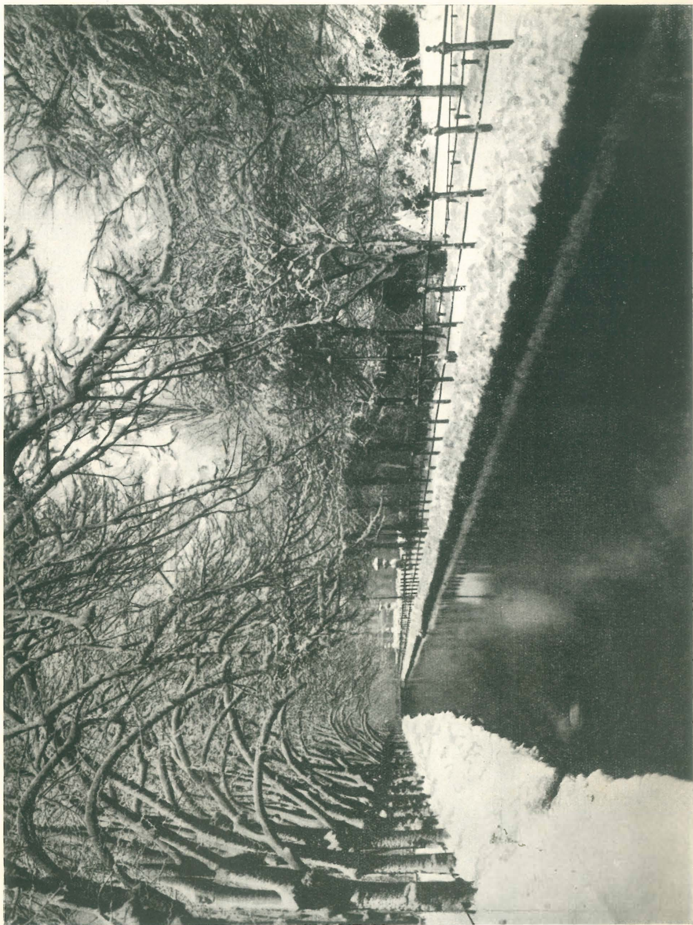
Winter im Hofgarten zu Düsseldorf.