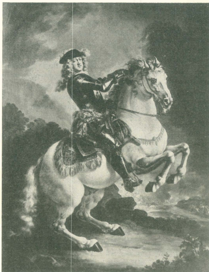
Kurfürst Johann Wilhelm (Jan Wellem) nach einem Gemälde von Franz Douven