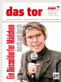
Titelmontage: Christian Küller