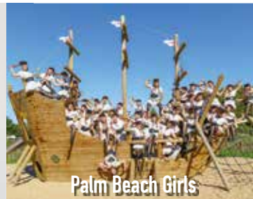
Palm Beach Girls