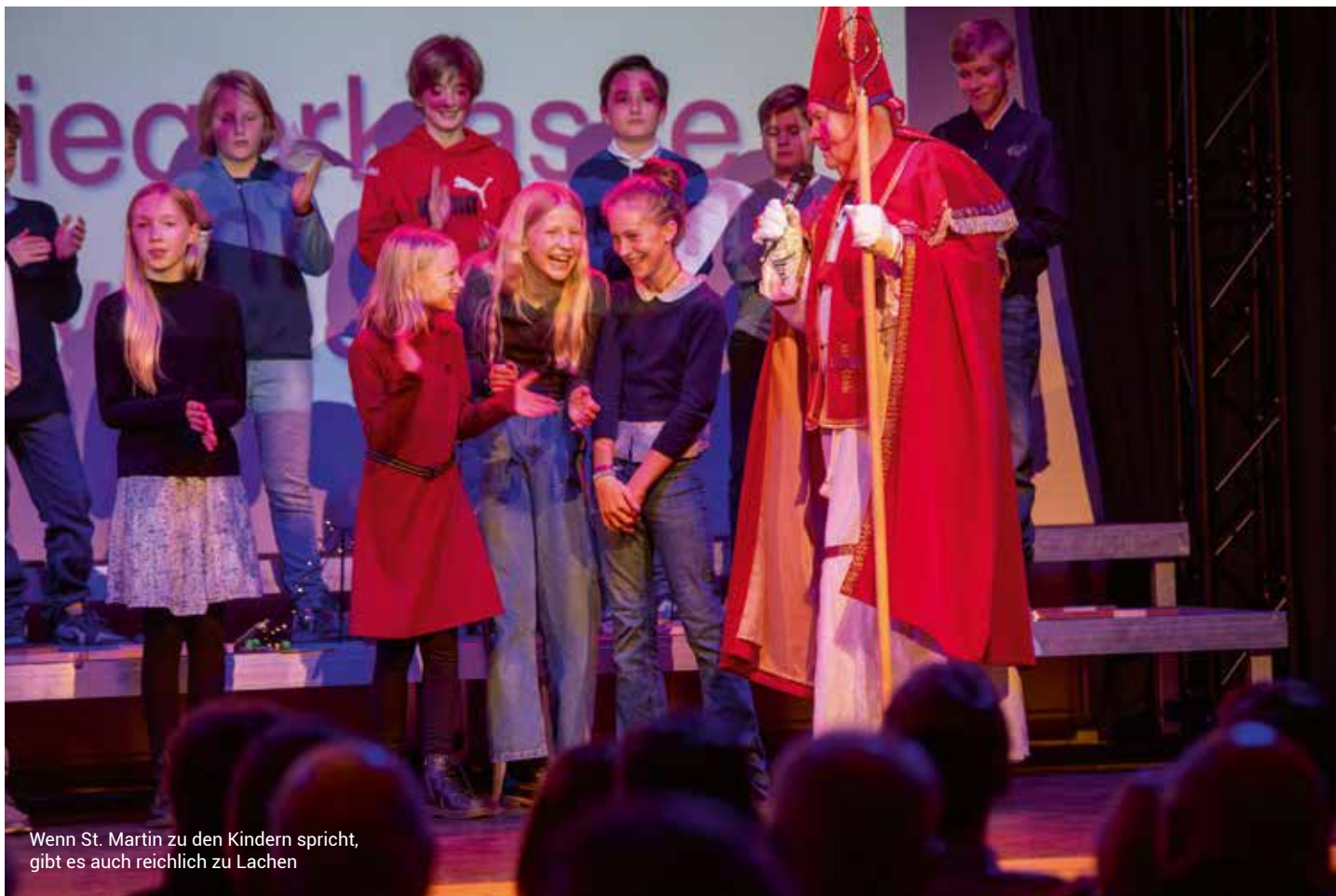
Wenn St. Martin zu den Kindern spricht, gibt es auch reichlich zu Lachen

2014 Mitglied der TG Reserve. Parkettsicher ist er auch. Die Kinder befragte er, wie sie im Kleinen anderen auch helfen könnten. Ein Junge meinte, er lasse seine Freunde abschreiben, wenn sie die Hausaufgaben nicht geschafft haben. Riesen-Applaus gab's dafür von den Erwachsenen. Munter und selbstbewusst waren die Sechstklässler. Eine Schülerin erzählte, warum es zu St. Martin Gänsebraten gibt. „Weil die Gänse im Stall auf